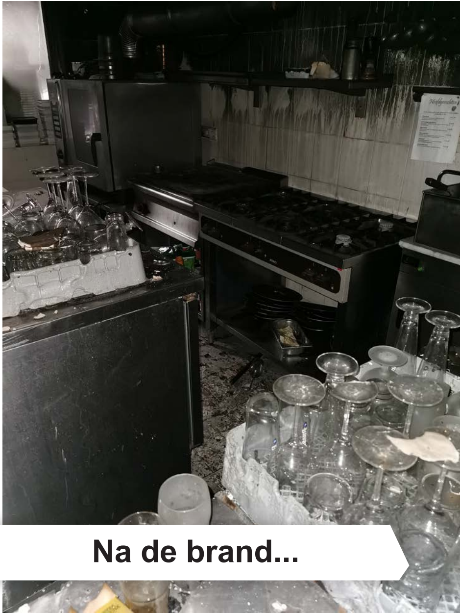
Na de brand...