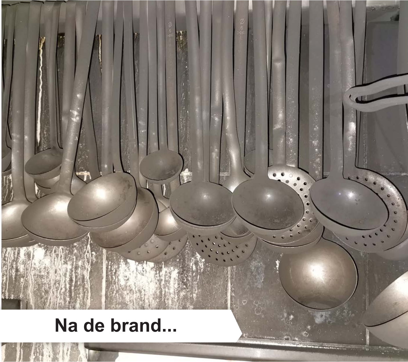
Na de brand...