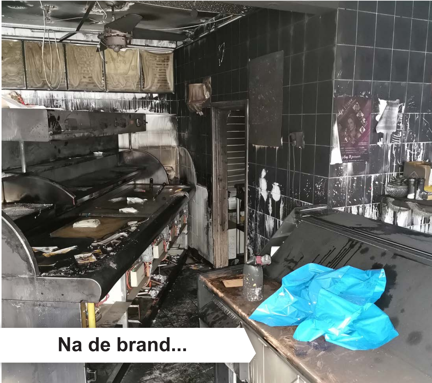
Na de brand...